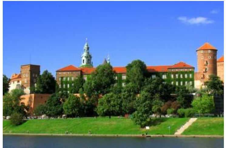
ZAMEK KRÓLEWSKI NA WAWELU

Jeżeli kiedykolwiek będzie w Krakowie to na pewno usłyszenie jeden ze słynnych hejnałów, który rozbrzmiewać będzie z Wieży Mariackiej. Hejnał to sygnał muzyczny oznajmia godziny lub grany jest w razie wybuchu pożaru np. przez strażnika wieżowego na trąbce. Słynny hejnał mariacki grany jest co pełną godzinę. A oto jego legenda „O przerwany hejnale”