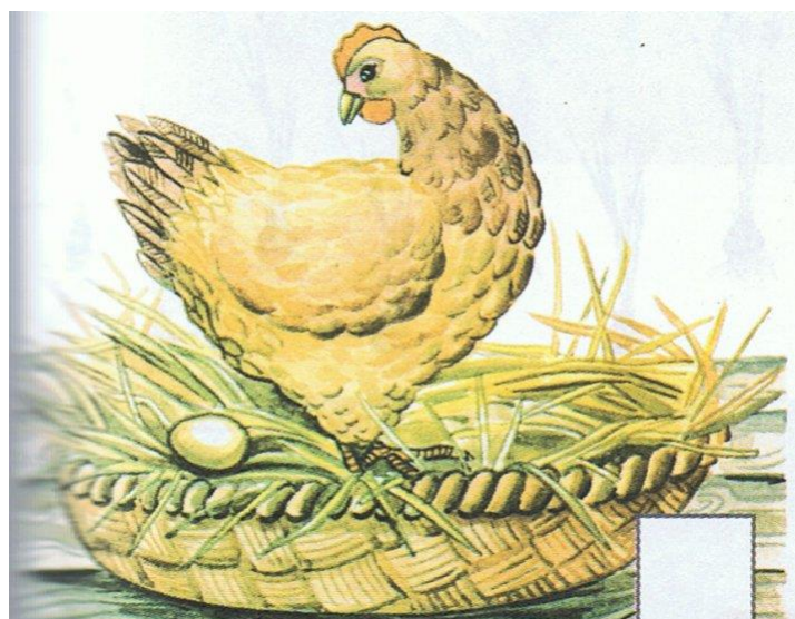
Ta kura zniosła jajko