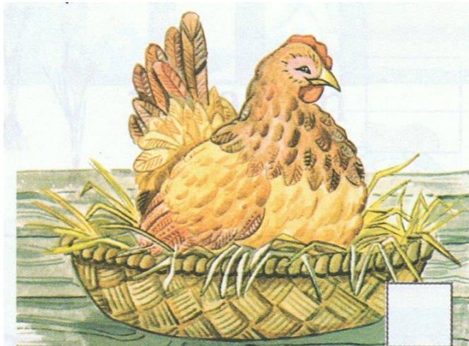
Kura usiadła na jajku, aby było mu ciepłutko