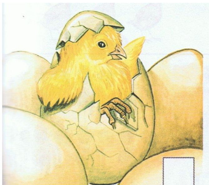
Nagle skorupka pękła i wykuł się kurczak

Opowiedzcie teraz proszę historię kurczątka. Czy udało Wam się wszystko zapamiętać? Jestem przekonana, że tak. Super!