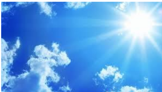
słonko no stop