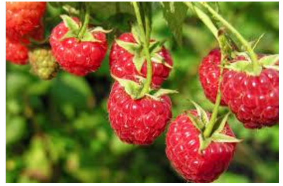
Za owoce: poziomki, jagody i maliny