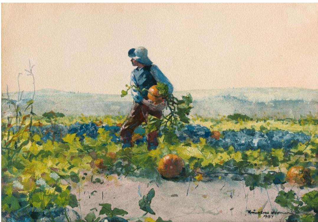
Winslow Homer For to be a farmer's boy