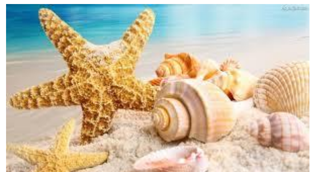
muszelki nad morzem