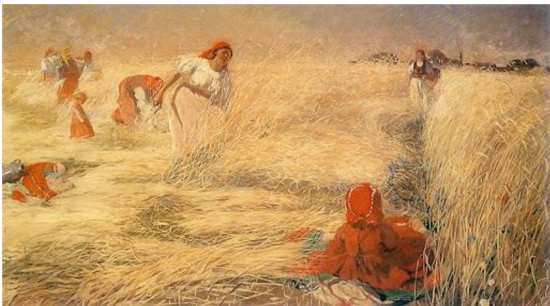
Włodzimierz Tetmajer Żniwiarki w polu

Czy wiecie, za co lubimy lato? – obejrzyjcie proszę reprodukcję obrazów przedstawiających. Opiszcie ich kolorystykę i nastrój. Zastanówcie się, z jaką porą roku wam się kojarzą i jakie oznaki lata przedstawiają. Nadajcie obrazom tytuły.