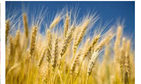
Za młode ziemniaki, warzywa i zboże na polu