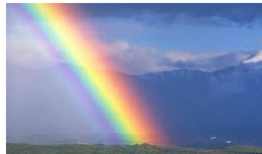
kolorowe paski na niebie